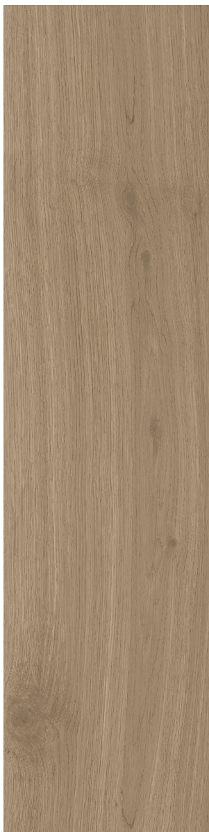
CARAMEL (Beige) 22.5 x 90 cm (9" x 36") Fini mat Épaisseur nominale 8 mm WA.WD.CML.0936.MT