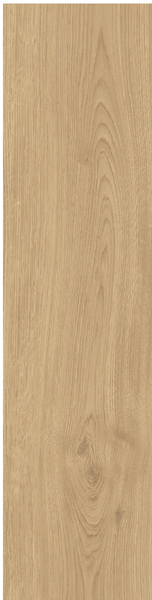
SUCRE (Beige Pâle) 22.5 x 90 cm (9" x 36") Fini mat Épaisseur nominale 8 mm WA.WD.SGR.0936.MT