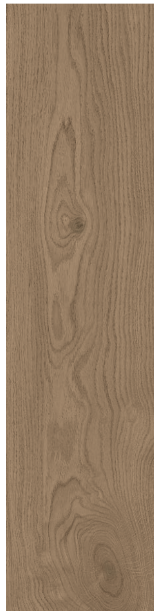
TAMARIND (Brun) 22.5 x 90 cm (9" x 36") Fini mat Épaisseur nominale 8 mm WA.WD.TMD.0936.MT

Tous les items présentés dans ce document font partie du programme d'inventaire Olympia . Pour les commandes spéciales, veuillez contacter votre représentant de Tuiles Olympia.