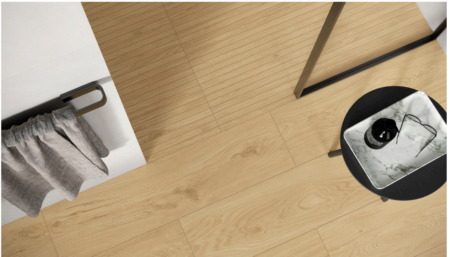
SUCRE (Beige Pâle)